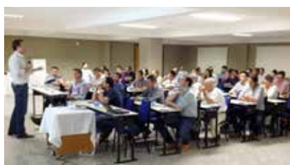
Rio Verde / GO