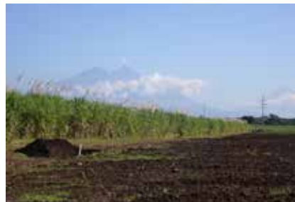
Área de produção de cana-de-açúcar Guatemala

Em seguida visitamos as usinas Magdalena com 54.000ha, La Union 40.000ha e Pantaleon 64.000ha(esta última possuindo uma unidade no Brasil), onde podemos verificar as condições de produção em escala muito semelhantes a do Brasil antes da chegada da colheita mecânica em nossos canaviais.