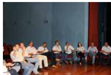
Treinamento R.S.S - Vendas por relacionamento