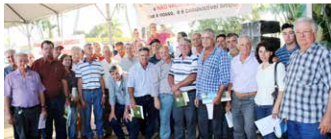
Ato Publico - Sertãozinho