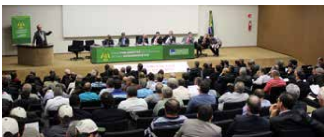
Frente Parlamentar - São Paulo