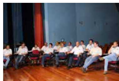
Treinamento R.S.S - Vendas por relacionamento