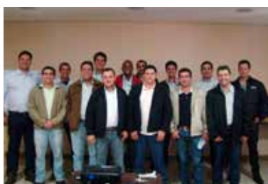
Treinamento Gestão de Vendas