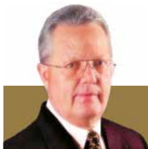
AFOCAPI SICOOB COCREFOCAPI SINDIRPI