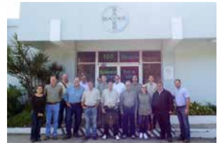
Visita ao Centro de Pesquisa Cengicanã

Variedades mais plantadas na Guatemala, CP 722086 e CP 881165, com média de 105 Ton/Ha, em 5 cortes.