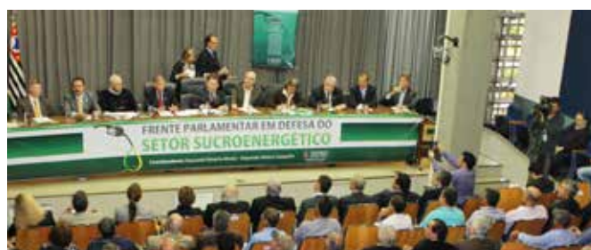
Frente Parlamentar - Brasília